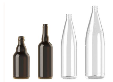
Prototypes d'emballages standard

Une association environnementale a demandé la mise en place d'une consigne obligatoire pour le réemploi sur les emballages ménagers et à défaut un renforcement des pénalités incitant au réemploi, celles-ci lui paraissant insuffisantes par rapport aux primes. L'État a rappelé que le projet de cahier des charges prévoyait des primes pour les emballages réemployables et une pénalité portant au moins sur les mises sur le marché d'emballages à usage unique lorsqu'un emballage réemployable était disponible pour les mêmes catégories de produits.