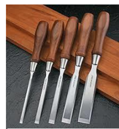
Affûtage des objets tranchants ou coupants

La labellisation des réparateurs serait un processus allégé et gratuit, le contrôle des réparateurs se faisant par des audits a posteriori.