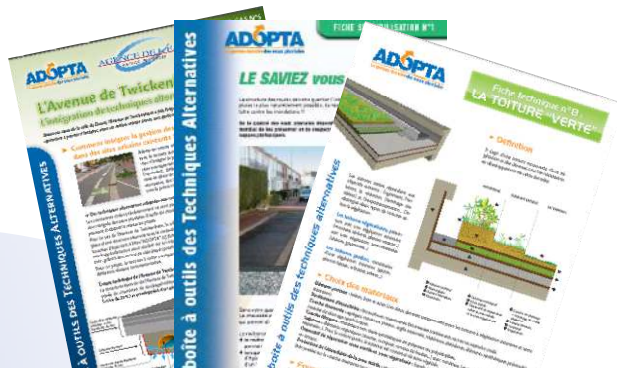
Des publications (fiches techniques, fiches de cas, fiches de sensibilisation...)